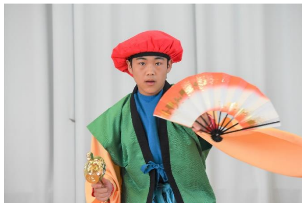
< 伝統芸能発表「清助新田大黒舞」 >