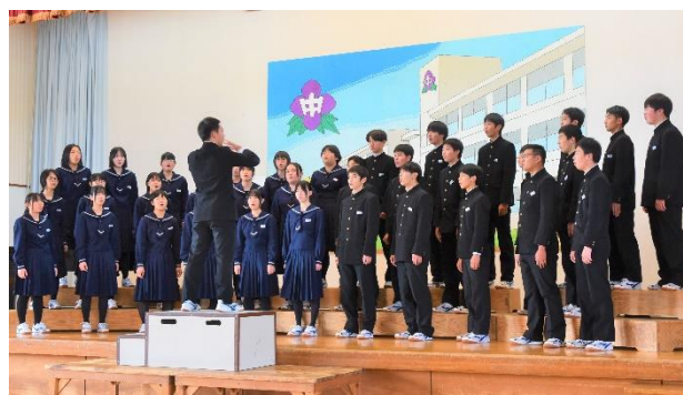
3年1組の合唱 「青い鳥」