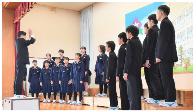
2年1組の合唱 「ヒカリ」