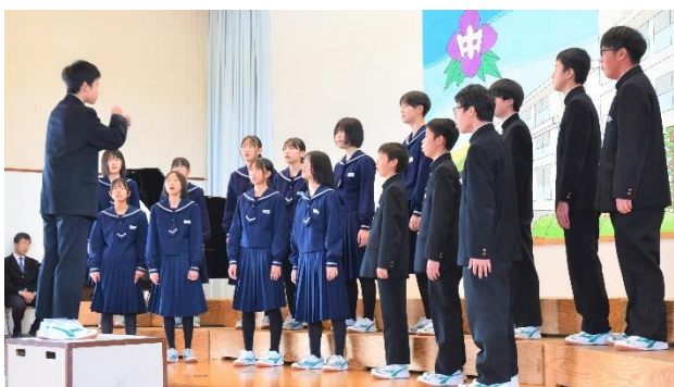
2年2組の合唱 「生きている証」