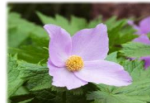
校章のモチーフ しらね葵