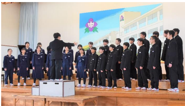
1年1組の合唱 「旅立ちの時」