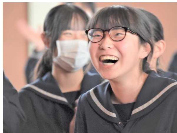
< 企画系の「未成年の主張」 >